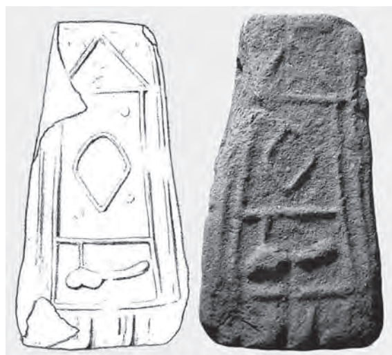
Fig. 2 - Peso da fondo Frassinara di Roncoferraro (Mn) (disegno e foto dell'Autore)