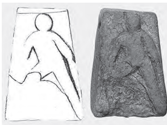
Fig. 3 - Peso da fondo Pedocca, loc. Pilastrini di Bondeno (Fe) (disegno dell’Autore, foto in CALZOLARI 1986, p. 214).