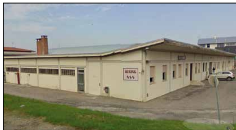
La sede dell'Auxing