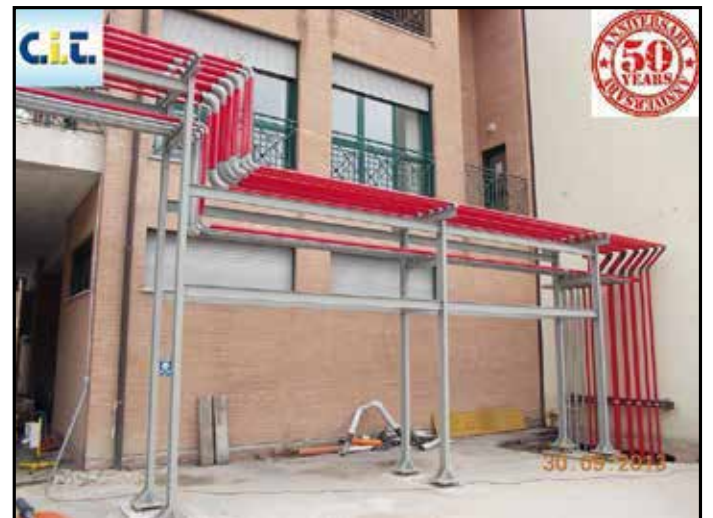
Intervento nella caserma dei Vigili del Fuoco di Ferrara