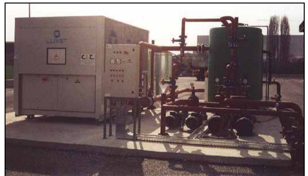
Un particolare impianto acqua refrigerata ubicato a Bondeno