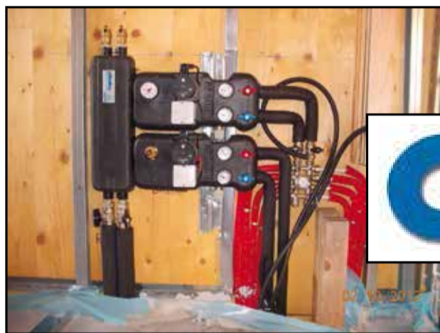
Centro Maria Regina Della Pace, Bondeno Impianto alta e bassa temperatura

come al principio della sua attività, la C.I.T. è un'impresa artigiana che si occupa di impiantistica di climatizzazione, condizionamento, idrotermosanitaria, riscaldamento, riqualificazione energetica, impianti solari termici, ricerca perdite di gas e acqua, antincendio, ecc.. Nei primi tempi la sede era in piazza Garibaldi, ma pochi anni dopo, attorno al 1968 fu trasferita in via Bonati; nel 1973 un nuovo spostamento portò la ditta in via Leopardi. L'ubicazione attuale e definitiva venne raggiunta nel 1995 in Via Pironi con l'acquisto di magazzino e ufficio. Con il passare del tempo, la C.I.T. si espanse progressivamente dal solo settore privato a quello pubblico. Questo