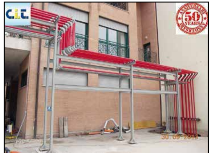
Intervento nella caserma dei Vigili del Fuoco di Ferrara